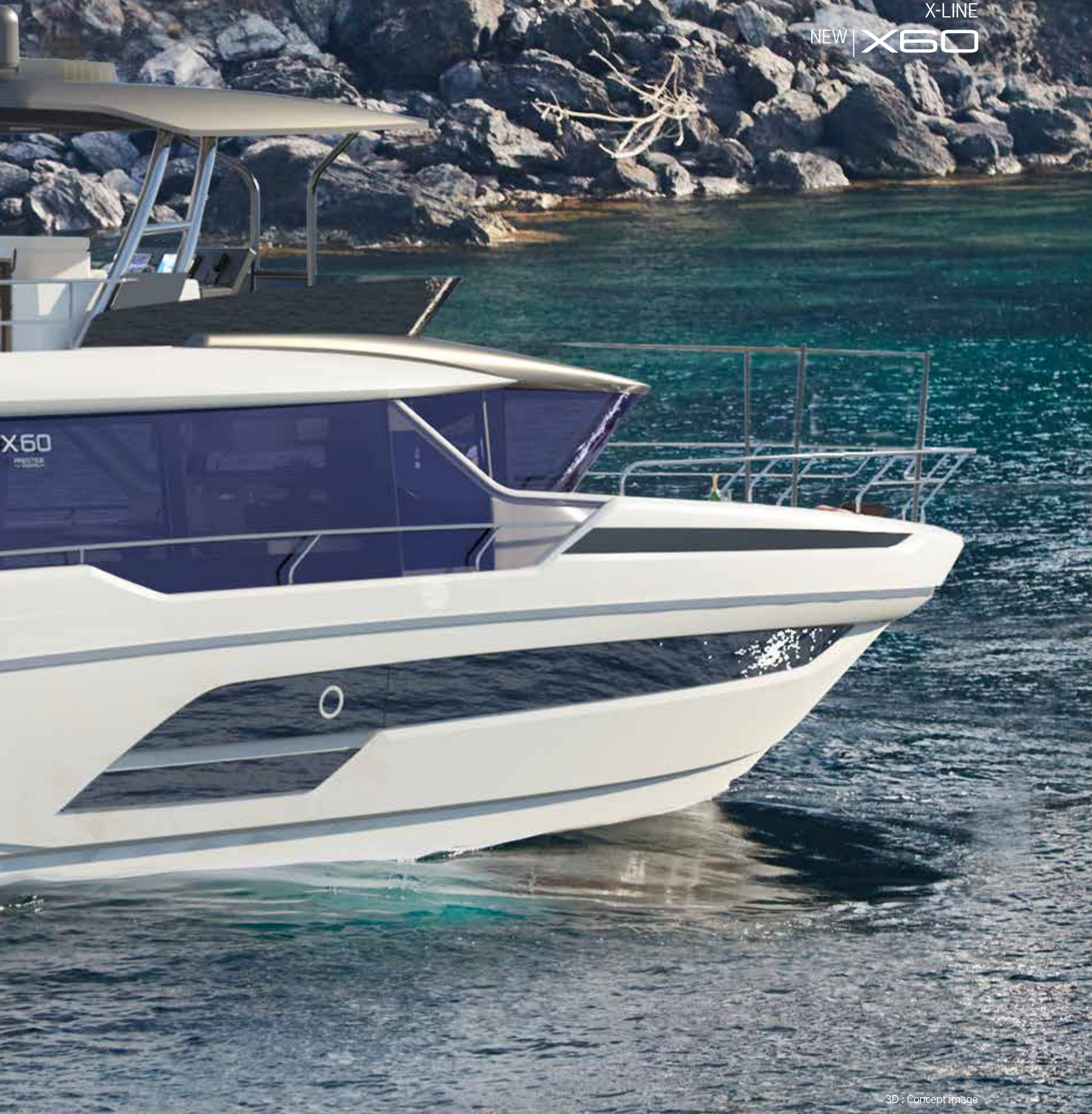
3D : Concept image