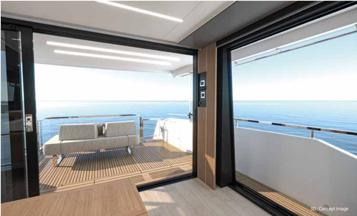
3D : Concept image