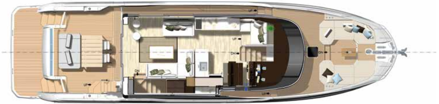
Main deck - Exterior dining version