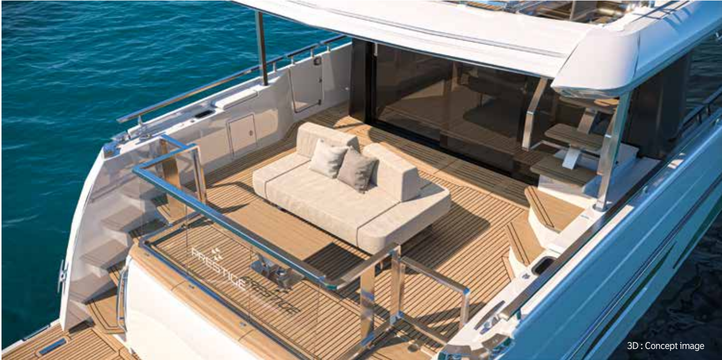
3D : Concept image