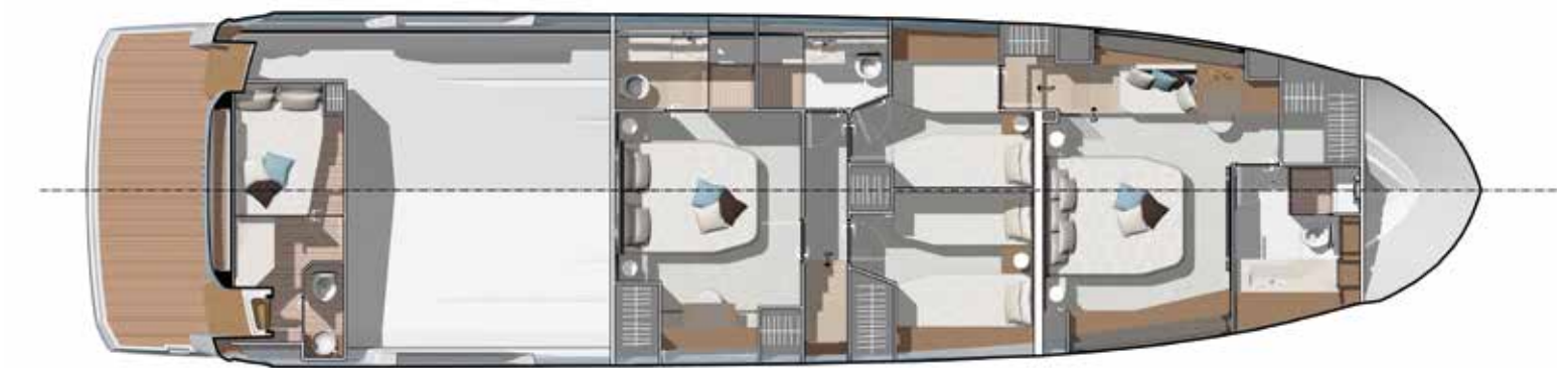
Lower deck - 4 Stateroom version