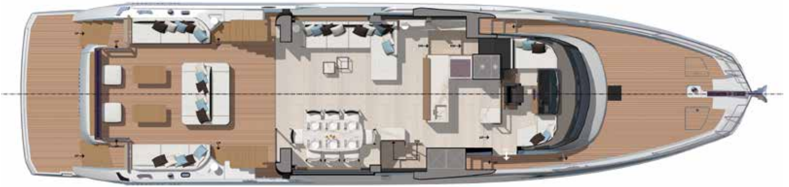
Main deck - Interior dining version