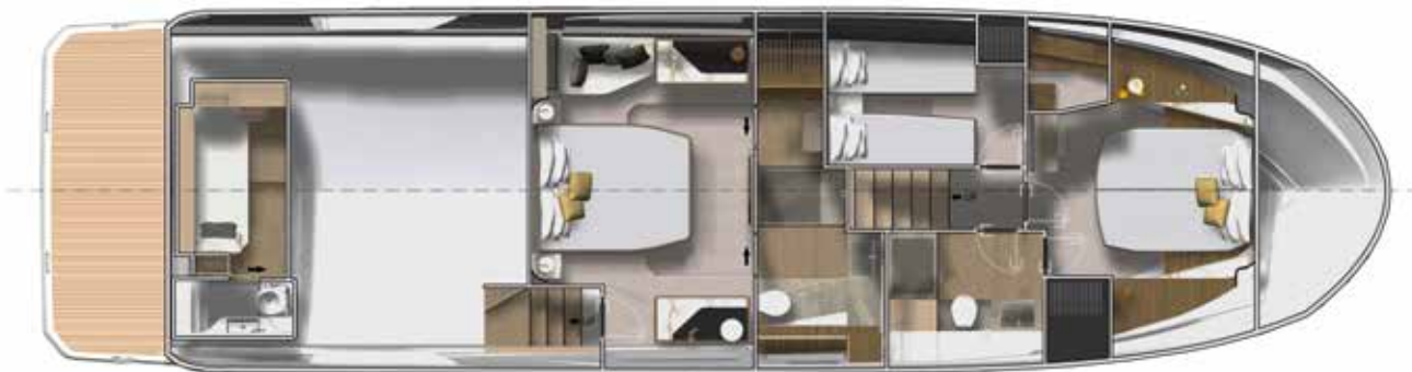
Lower deck - 3 Stateroom 2 Bathroom