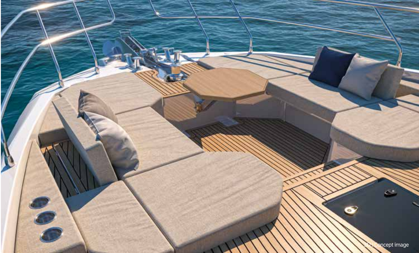
3D : Concept image