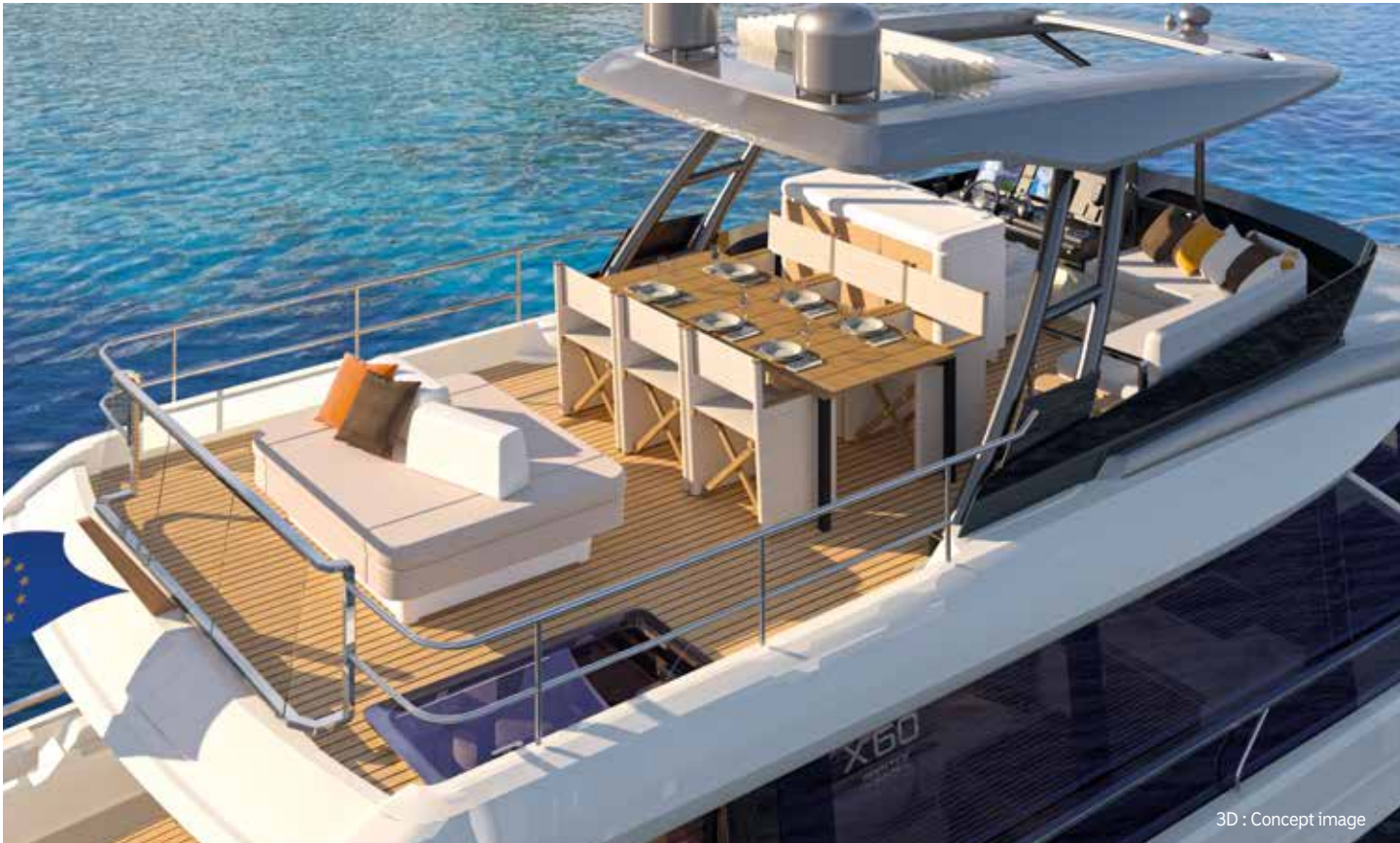
3D : Concept image