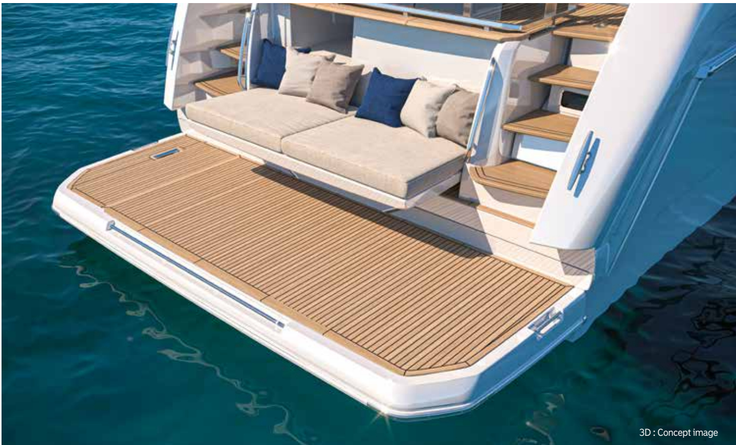
3D : Concept image