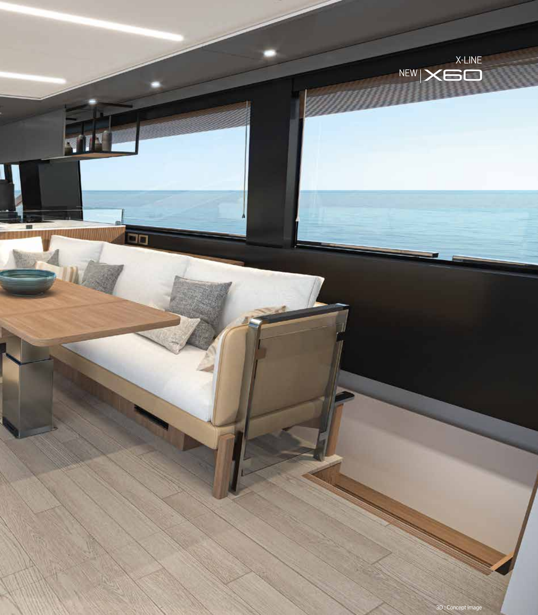
3D : Concept image