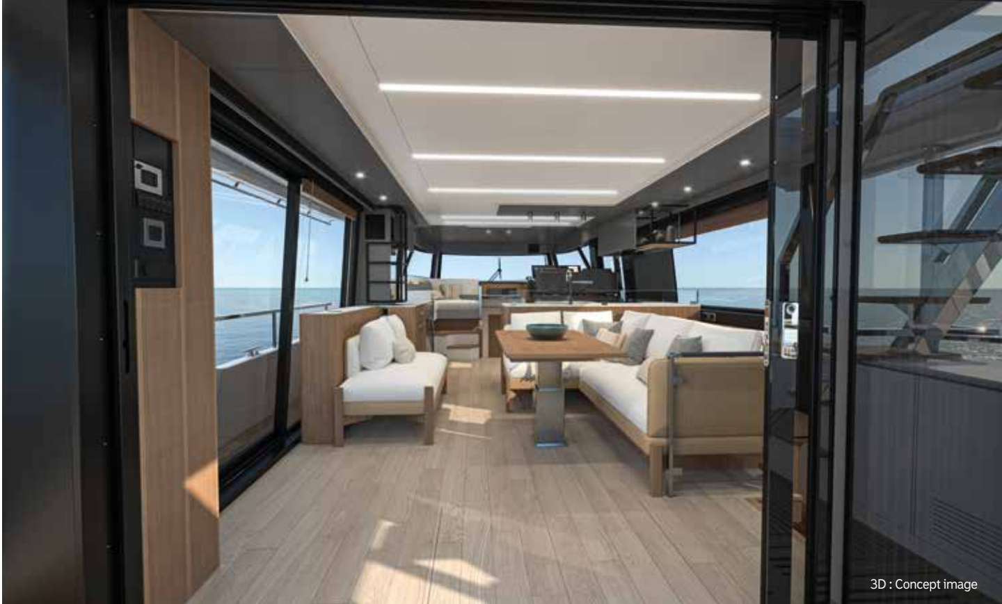
3D : Concept image