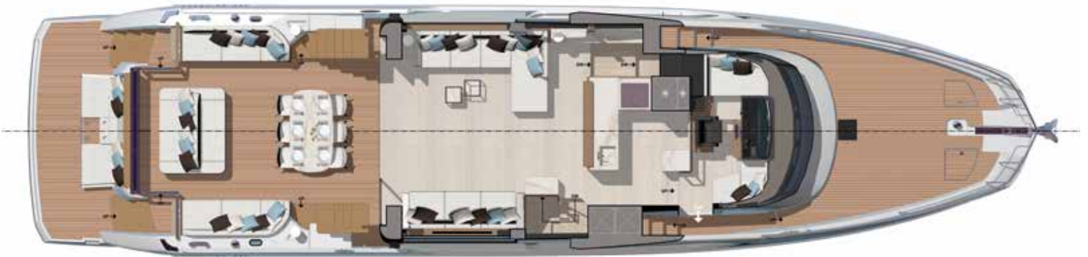
Main deck - Exterior dining version